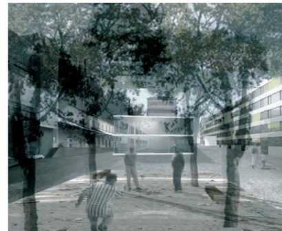
Gurten-Areal, Wabern / Köniz

Die Gurtenbrauerei in Wabern bei Köniz steht seit 1996 still. Nun soll auf dem Areal ein Ortsteil entstehen. Ein Teil der Altbauten, darunter die markante, hohe Hauptfront, soll für Gewerbe stehen bleiben, ebenso ein Betonbau aus den Siebzigerjahren. Vorne, gegen das Tal, ist ein mächtiger, langer Neubau mit hundert Wohnungen geplant.